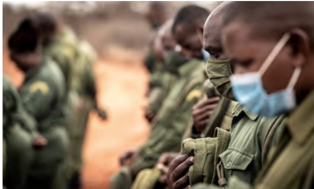
Crédito de la foto: LEAD Ranger del equipo de Wildlife Works en honor a dos camaradas recientemente caídos en el Día Mundial de los Rangers de 2021.

Estos informes se comparten con IRF y los detalles relevantes se registran para el cuadro de honor de los guardaparques caídos.