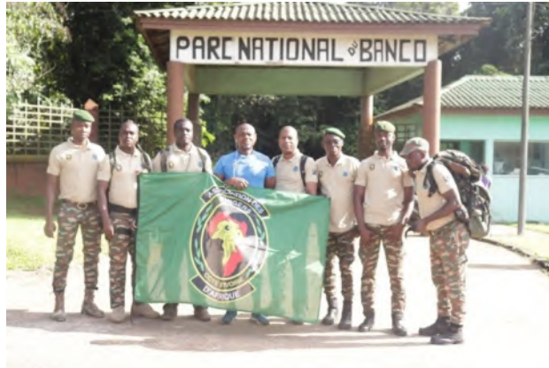
Crédito de las imágenes: Rangers de Costa de Marfil compitiendo en el Desafío de Guardabosques de Vida Silvestre

Además de anunciar los ganadores para 2021, el director ejecutivo de Game Rangers Association of Africa, Andrew Campbell, anunció un cambio importante y emocionante en el nombre oficial del evento. A partir de 2022, los Rhino Conservation Awards se conocerán como The African Conservation Awards, lo que destaca la necesidad de reflejar esfuerzos de conservación más amplios en todo el continente en apoyo de todas las especies.