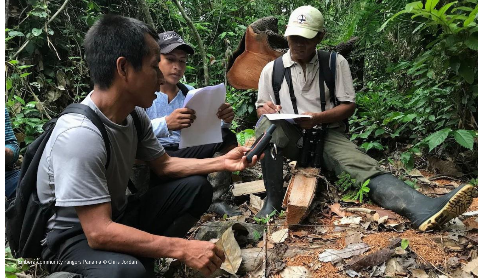
Emberá community rangers Panama

ความสามารถเหล่านี้ถูกกำหนดให้เป็นไปตามข้อกำหนดนี้ผ่านกระบวนการมีส่วนร่วมระหว่างปี 2021/2022 โดยมีขั้นตอนต่อไปนี้ (กรณารอก)