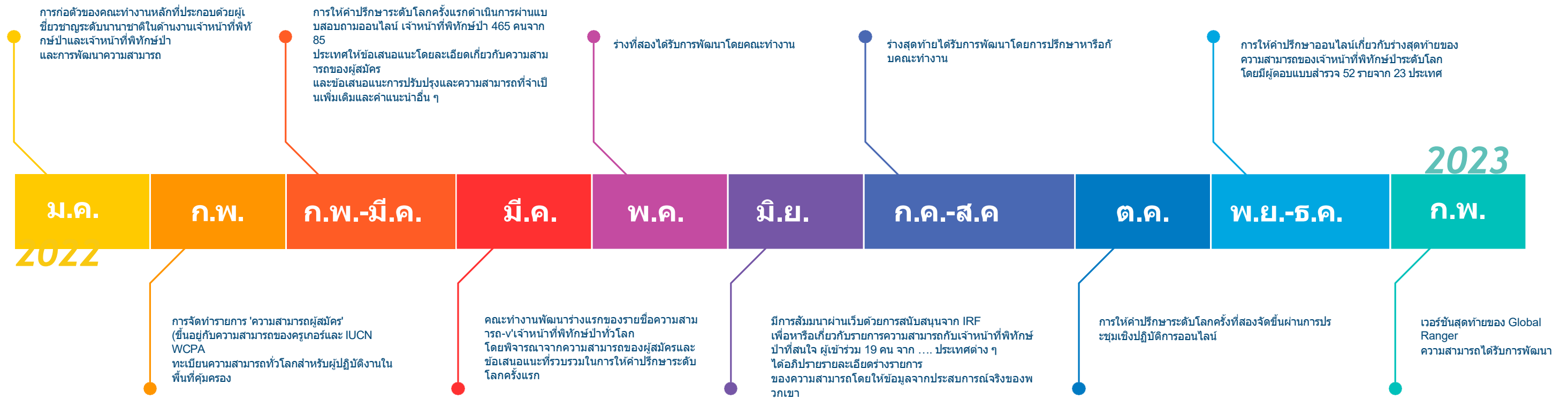
รูปที่ 2 เส้นเวลาสำหรับการพัฒนาขีดความสามารถของ Global Ranger