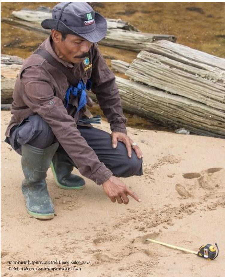
รอยเท้าแรดในอุทยานแห่งชาติ Ujung Kulon, Java