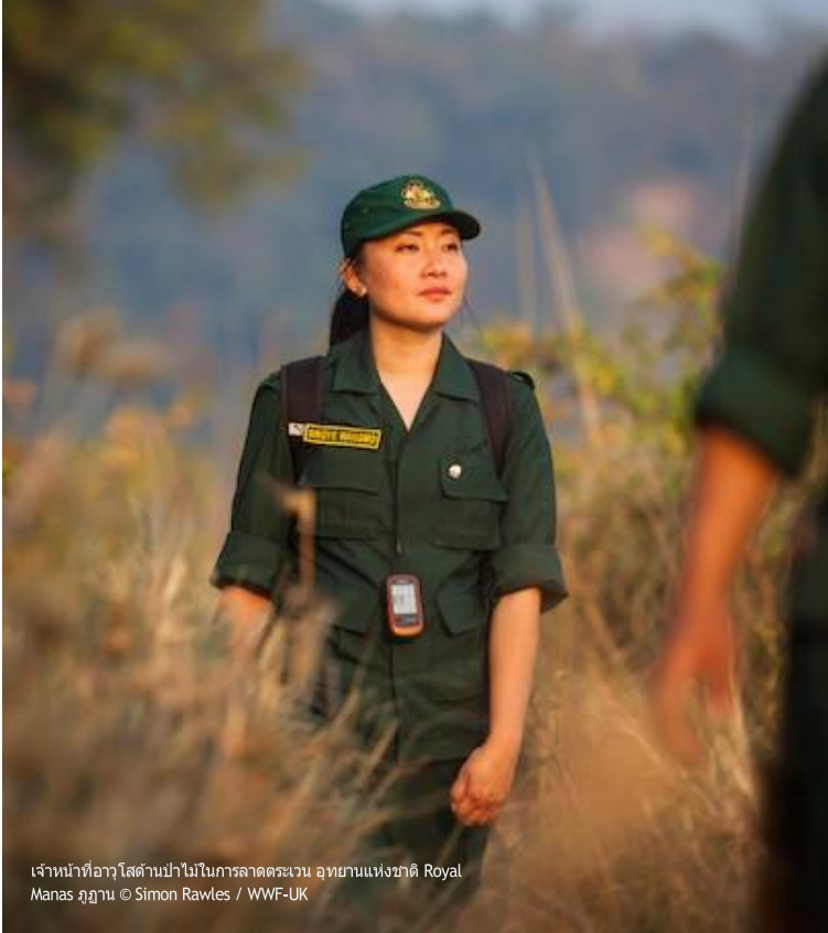
เจ้าหน้าที่อาวุโสตามป่าไม้ในภาคกลางตอนบน อุทยานแห่งชาติ Royal Manas ภูฏาน

ทักษะและพฤติกรรมส่วนบุคคลขั้นพื้นฐาน - ความเป็นผู้นำ การสื่อสาร การทำงานเป็นทีม การคิดอย่างเป็นระบบ การปรับตัว