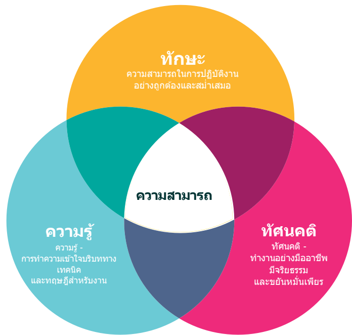
รูปที่ 1 - แบบจำลองทักษะ-ความรู้-ทัศนคติสำหรับความสามารถ(การออกแบบชั่วคราว ปรับปรุง)

ทักษะและพฤติกรรมส่วนบุคคลขั้นพื้นฐาน - ความเป็นผู้นำ การสื่อสาร การทำงานเป็นทีม การคิดอย่างเป็นระบบ การปรับตัว