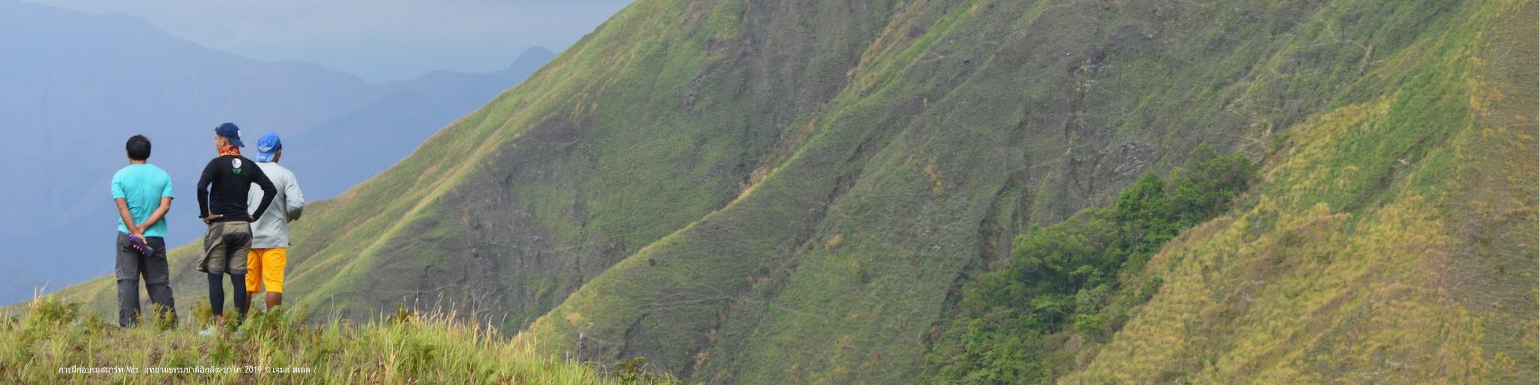
การฝึกอบรมสมารท Mts. อุทยานธรรมชาติอภิลด-นาโก 2019