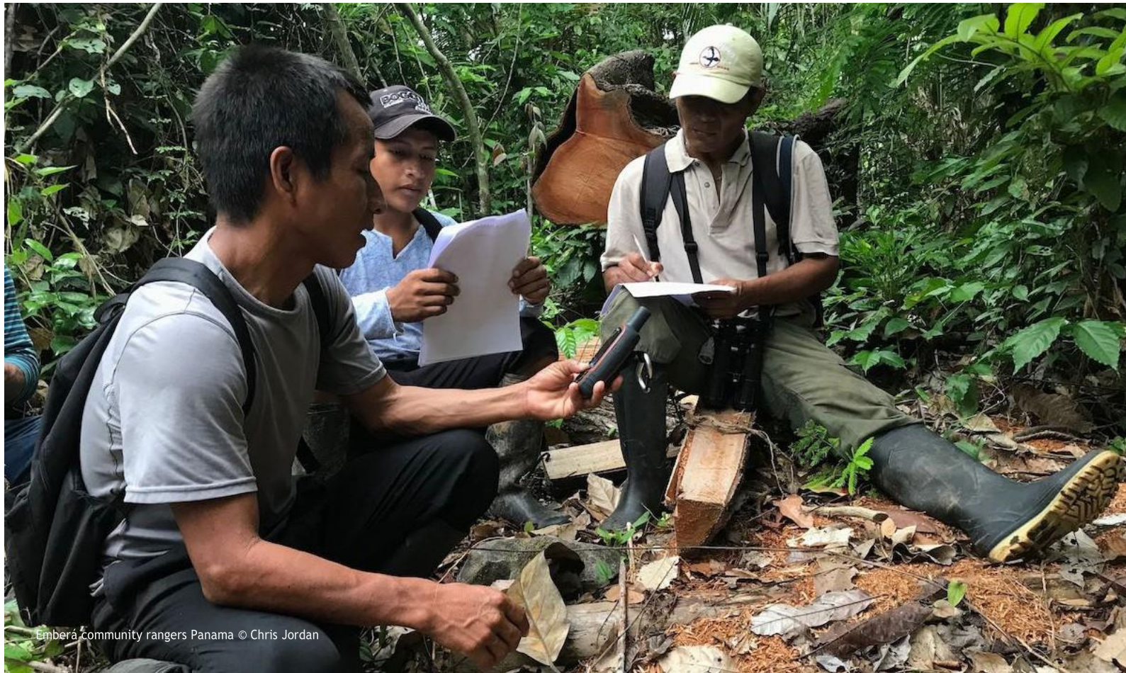
Emberá community rangers Panama

ផែនការសកម្មភាពរបស់ URSA ទទួលបានល្អពីការសម្របសម្រួលដាក់លាក់និងបានព្រមព្រៀង នៃអង្គការខ្មែរឧទ្យានរុក្ខជាតិលើសកលដែលអាចធ្វើ និងរួមបញ្ចូលនូវកិច្ចការជាក់លាក់ដូចមានតទៅ៖ ការប្រមូលផ្តុំនៃជំនាញស្នូលទូទៅ និងជំនាញឯកទេសសម្រាប់ខ្មែរឧទ្យានរុក្ខជាតិលើសកល និងសម្រាប់តួនាទីខ្មែរឧទ្យានរុក្ខជាតិខ្មែរ និងទំនួលខុសត្រូវដែលអាចត្រូវបានសម្របសម្រួលទៅតាមការប្រើប្រាស់ក្នុងមូលដ្ឋាន។ ជំនាញទាំងនេះត្រូវបានកំណត់ដើម្បីបំពេញតម្រូវការនេះតាមរយៈដំណើរការចូលរួមក្នុងកំឡុងឆ្នាំ 2022/2023 (សូមមើលរូបភាពទី 2)។