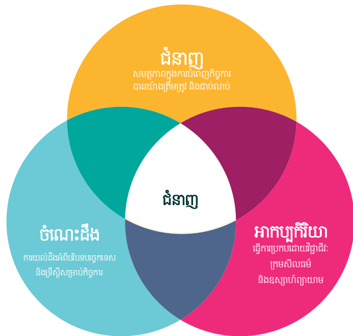
រូបភាពទី 3 - គំរូ ជំនាញ-ចំណេះដឹង-អាកប្បកិរិយាសម្រាប់ជំនាញទី 6

ជំនាញមូលដ្ឋានបុគ្គល និងអាកប្បកិរិយាភាពជាអ្នកដឹកនាំ ការទំនាក់ទំនង ការធ្វើការងារជាក្រុម គំនិតគ្រឹះវិះ ការគិតជាប្រព័ន្ធ ការសម្របសម្រួល