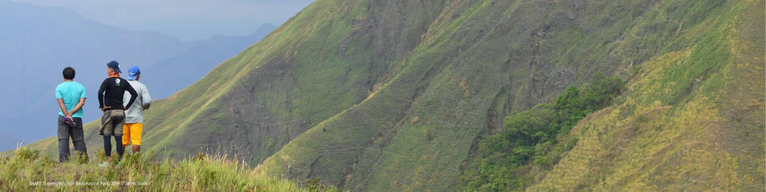
SMART Training Mts. Iglit-Baco Natural Park, 2019