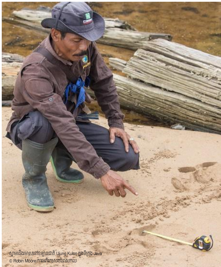
ស្រាវជ្រាវនៅខ្សាច់ជាតិ Ujung Kulon ក្នុងទីក្រុង Java