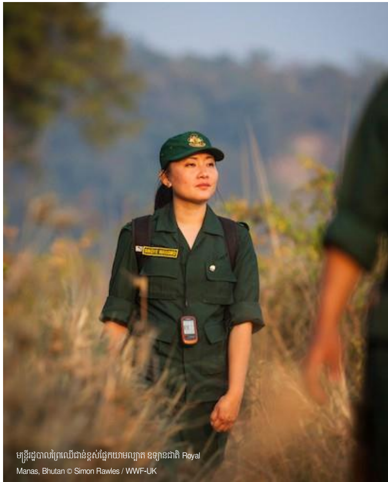
មន្ត្រីរដ្ឋបាលព្រៃឈើជាន់ខ្ពស់ផ្នែកយោធា ខ្សាច់ជាតិ Royal Manas, Bhutan

ជំនាញមូលដ្ឋានបុគ្គល និងអាកប្បកិរិយាភាពជាអ្នកដឹកនាំ ការទំនាក់ទំនង ការធ្វើការងារជាក្រុម គំនិតគ្រឹះវិះ ការគិតជាប្រព័ន្ធ ការសម្របសម្រួល