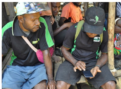
Lukim Gather App Training